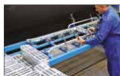
Soudure robotisée pour un cordon toujours identique