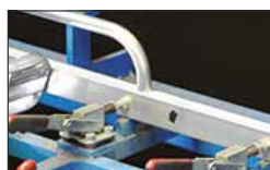
Encastrement mécanique extrêmement robuste et anti-rotation