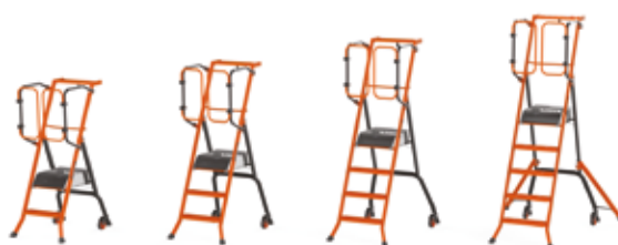
110cm avec stabilisateurs