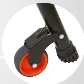
Roues sur ressort