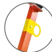
Anneaux de grutage : 2 anneaux à boulonner (visserie incluse) Ref. 202103 Gencod : 3479132021035